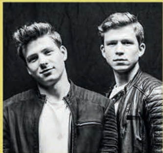
O'BROS KONZERT SO 20UHR

GÄSTE BEKOMMEN IHRE TICKETS [8€] UNTER PROCAMP.ORG/#TAGESGAESTE TEILNEHMER BRAUCHEN KEINE TICKETS!