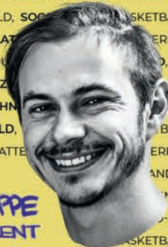
FLOO HOPPE REFERENT

BEACHVOLLEYBALLFELD, SOCCER- UND BASKETBALL COURT, FUBBALL- PLATZ, TISCHTENNISPLATTE, KLETTERWAND, FEUERPLATZ, ZEITRAUMAREA, MODERNE KLO- UND DUSCHWÄGEN, BISTRO, BAND, 150 GESCHULTE MIT- ARBEITER, AUFGEBAUTE ZELTE, STARKE GEMEINSCHAFT, VERANSTAL- TUNGSZELT MIT FETTER BÜHNE UND MEGA SOUND- UND TECHNIKANLAGE, BEACHVOLLEYBALLFELD, SOCCER- UND BASKETBALL COURT, FUBBALL- PLATZ, TISCHTENNISPLATTE, KLETTERWAND, FEUERPLATZ, ZEITRAUMAREA, MODERNE KLO- UND DUSCHWÄGEN, BISTRO, BAND, 150 GESCHULTE MITAR- BEITER, AUFGEBAUTE ZELTE, STARKE GEMEINSCHAFT, VERANSTALTUNGS- ZELT MIT FETTER BÜHNE UND MEGA SOUND- UND TECHNIKANLAGE, BEACHVOLLEYBALLFELD, SOCCER- UND BASKETBALL COURT, FUBBALL- PLATZ, TISCHTENNISPLATTE, KLETTERWAND, FEUERPLATZ, ZEITRAUMAREA, MODERNE KLO- UND DUSCHWÄGEN, BISTRO, BAND, 150 GESCHULTE MIT-